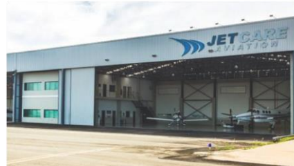
Sorocaba, SP – Brazil Hangar Jetcare Aviation