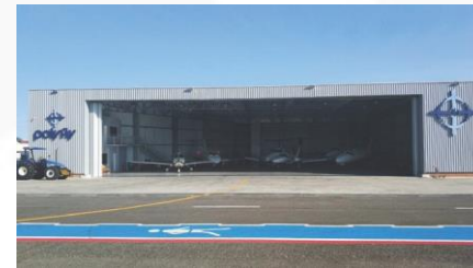
Navegantes, SC – Brazil Hangar PolyFly