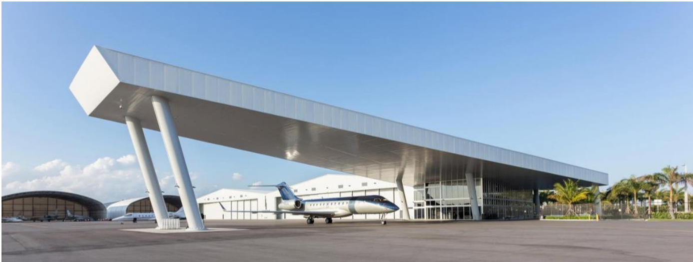
Headquarters: Fontainebleau Aviation, Miami-Opa locka Executive Airport, FL - USA